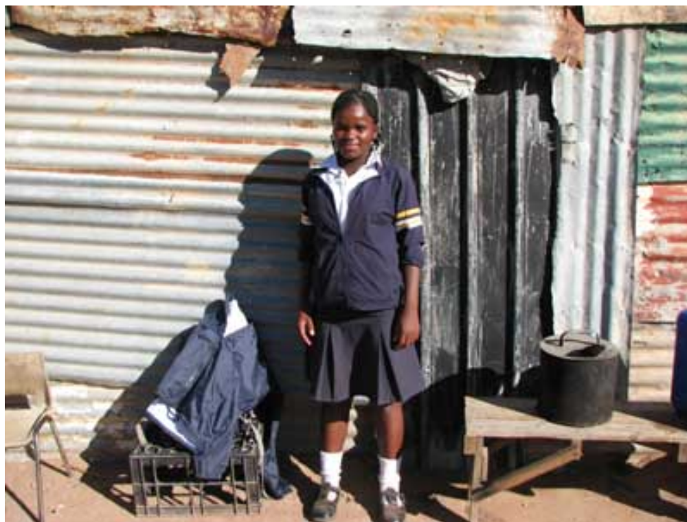
Prudence foran hjemmet i Vaalwater