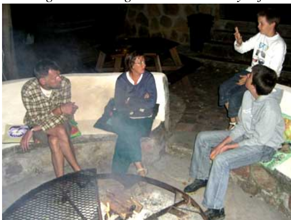
Dagens oplevelser diskuteres på lodgen