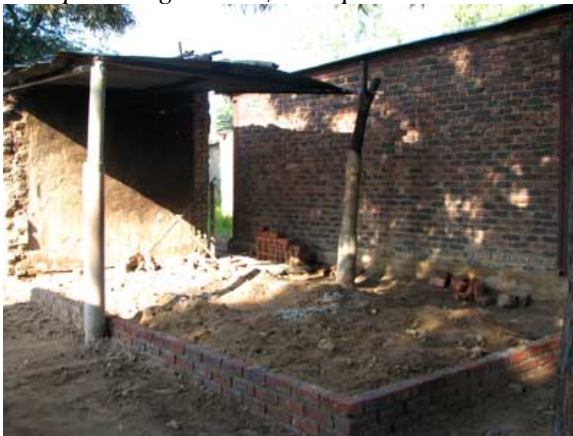
Skolekøkken under opførelse