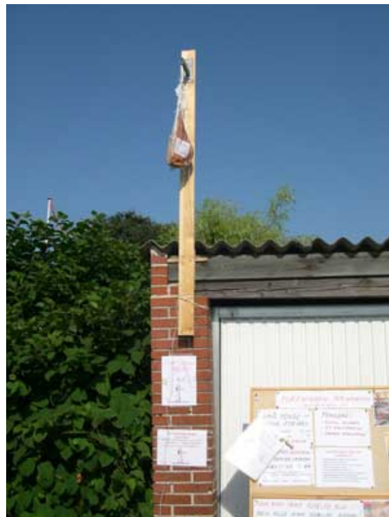
"Gæt skinkens højde og vind den"