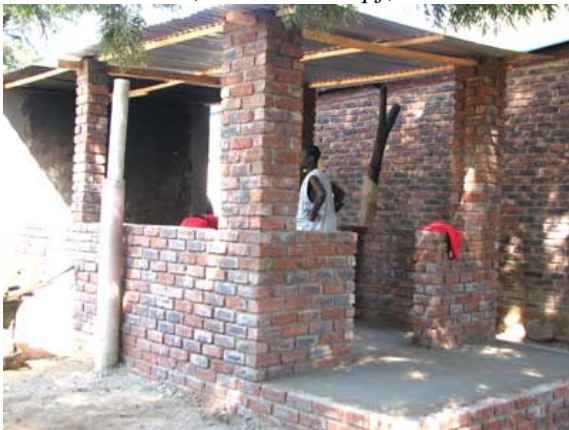
Det næsten færdige skolekøkken