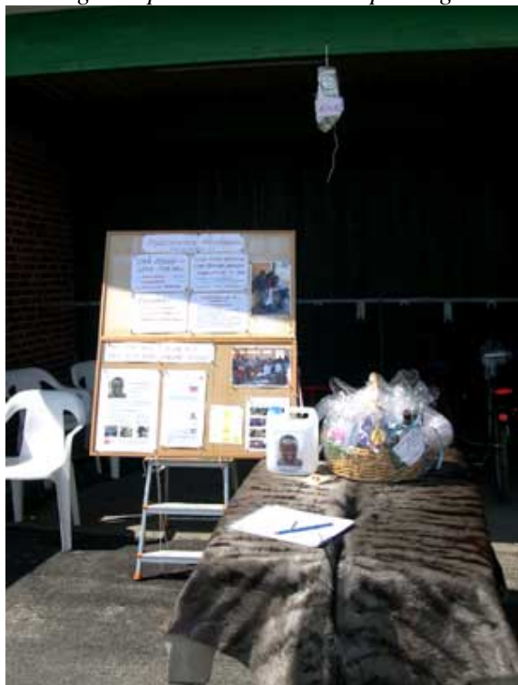
Endelave havnefest, Afrikaskolens stand