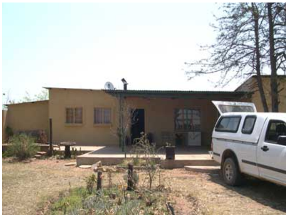
Bushveld Missions hovedhus, hvor de nu bor 4 voksne og 6 mindre forældreløse børn