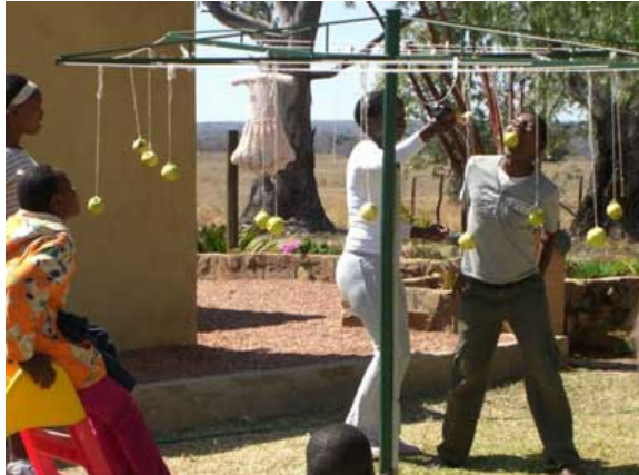
Her er en æbleleg ved et børnearrangement