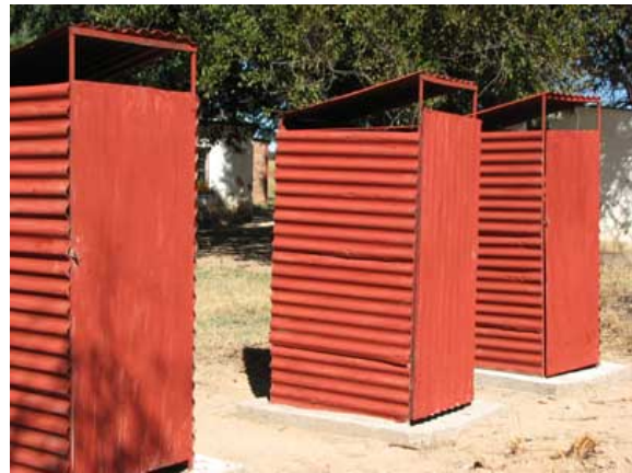
De nye toiletter