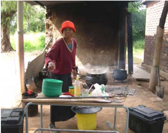
Oprindeligt skolekøkken på Reathlhlwa