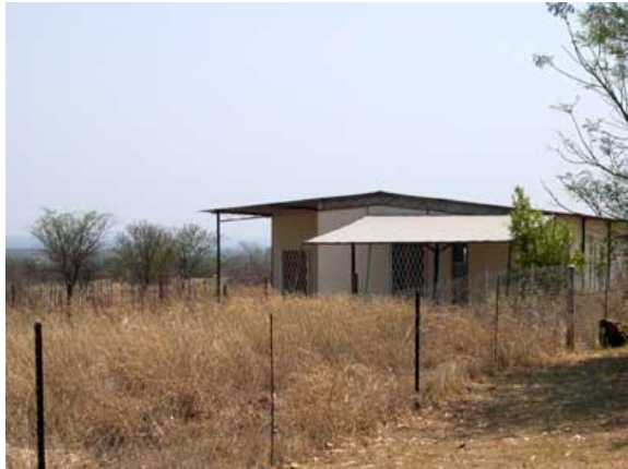
Thabile (Trust) residence, hvor 7 hjemløse drenge bor og dagligt går i secondary school