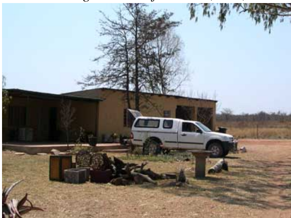
De 2 garager, der ombygges og udvides til Themba (Joy) care centre med soverum og skolestue til forældreløse mindre børn