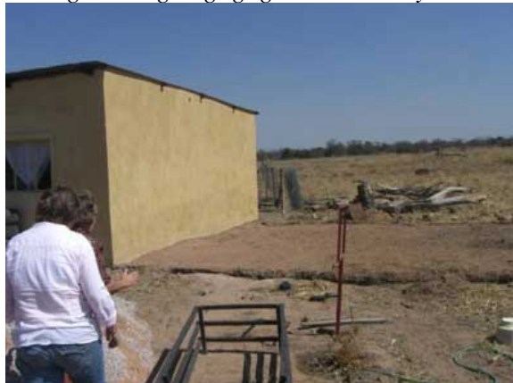
Fundament til udvidelsen er støbt, men der mangler penge til færdiggørelsen